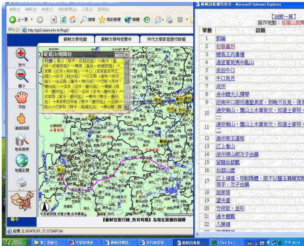
圖一：蘇軾從眉山至開封所經之地及所寫的詩