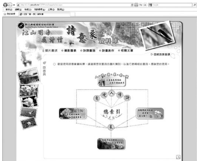
圖 3 詩意象資料庫：江山明秀飛詩情首頁圖

「詩意象」單元基於文學作品中物我交融互動的概念而設計，目的是讓使用者研讀詩詞時，從圖檔中尋