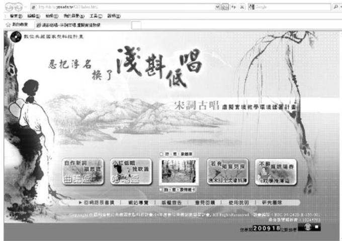
圖 2 網站首頁圖