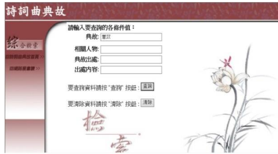
圖 3 典故檢索欄位頁