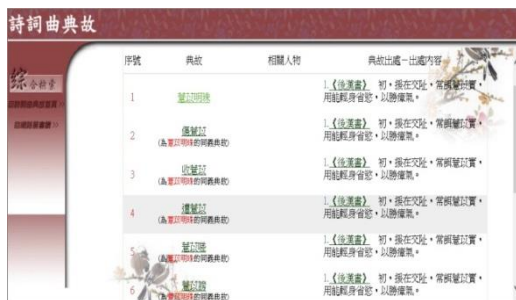
圖 4 典故檢索結果列表頁