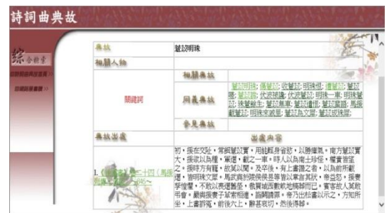
圖 5 典故知識內容頁

如前所言，詩詞曲典故建構之初，是為了幫助讀者辨識及解讀詩詞中的典故用語及語意，其資訊表達方式如圖 6、圖 7：