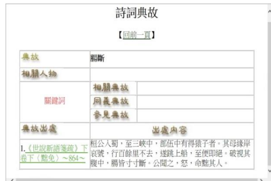
圖 7 「斷腸」之典故知識頁

圖 6 是臺灣古典漢詩網站之詩作內容（羅鳳珠、范毅軍 2011），系統之知識表達，設計了「標示典故」（右上角）功能，使用者如欲了解這一首詩哪一些詞句用了典故，點選「標示典故」及「重新顯示」，則詩中典故詞彙便會以不同顏色顯示，再點選典故詞彙，即可連結至詩詞曲典故網站之該典故詞知識內容頁，幫助讀者降低閱讀詩作時理解典故的困難。