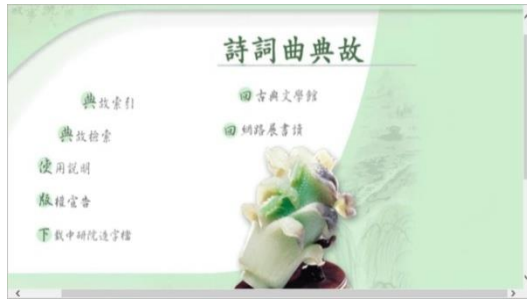
圖 2 網站功能頁