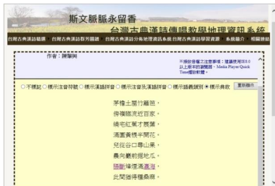
圖 6 陳肇興，王田二首之二

如前所言，詩詞曲典故建構之初，是為了幫助讀者辨識及解讀詩詞中的典故用語及語意，其資訊表達方式如圖 6、圖 7：